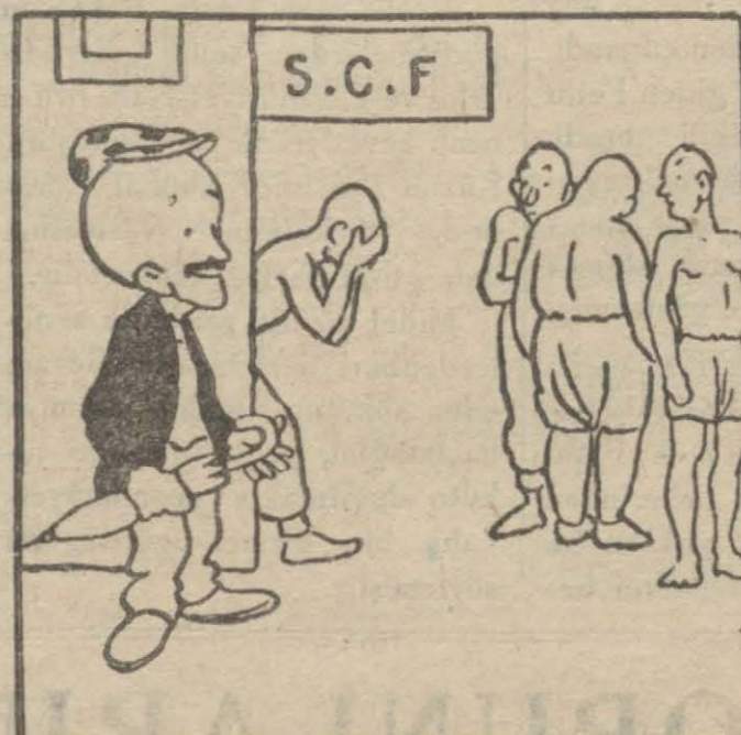
3 — Hasan B. — Sizin kabahatiniz nedir? Yeni zenginler — Biz de yaptığımız hanların, apartmanların hesabını veremedik.