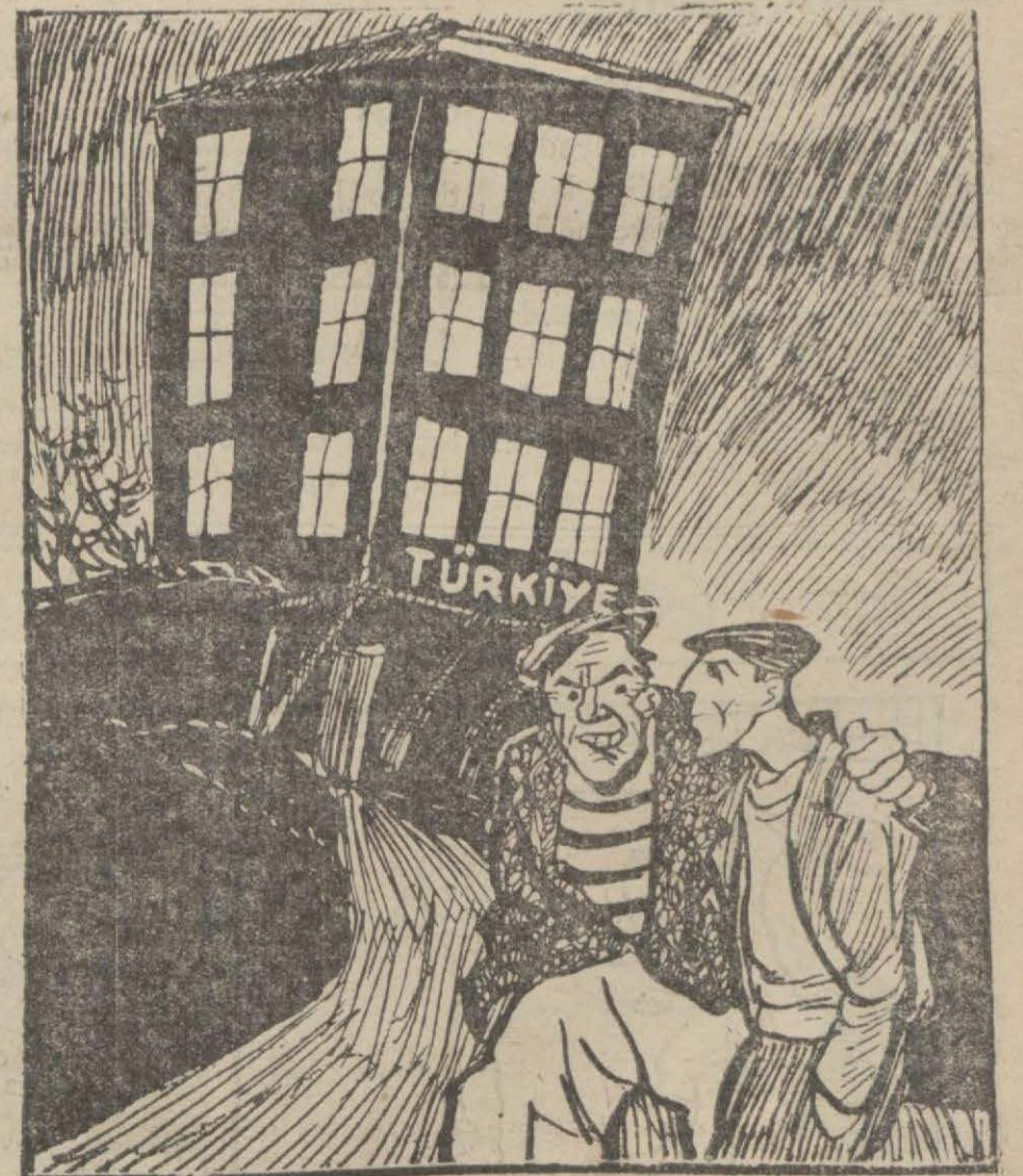
— Eyvah; içerdeki halk uyandı, ışıklar yandı, galiba hapyı yuttuk!