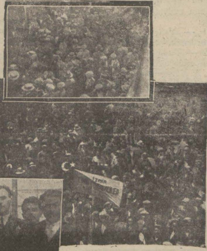
Urla Ve Kua Heyetleri..