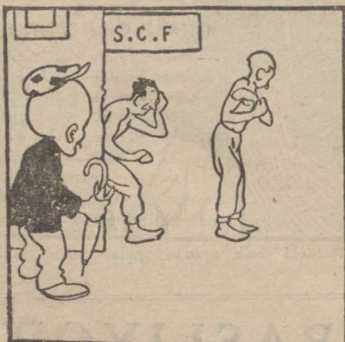
1 — Hasan B. — Ayol seni niçin böyle dövmüşler, soy-muşlar, diyorlar mı? Mutem! — Çamaşırımızı muayene ettiler, kırık buldu-lar, onun için soydular ve kapı dışarı attılar.